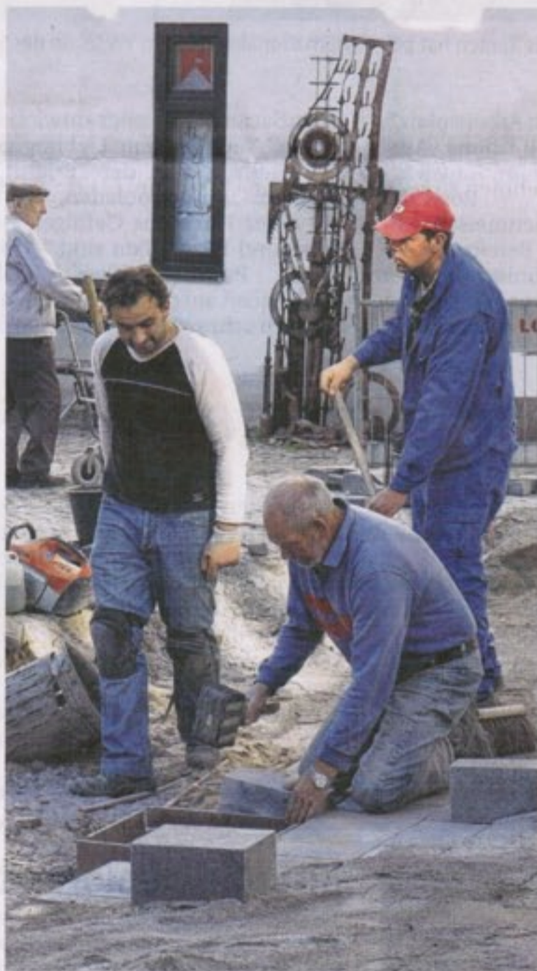
Der Nachschub rollt wieder: Gestern wurde am Mitteltor (Bild links) der Schlussstein für den Gehstreifen gelegt. Bild rechts: die letzten Pflastermeter bis zum Michaelstor . Auf die totale Kanalsanierung wurde hier verzichtet.