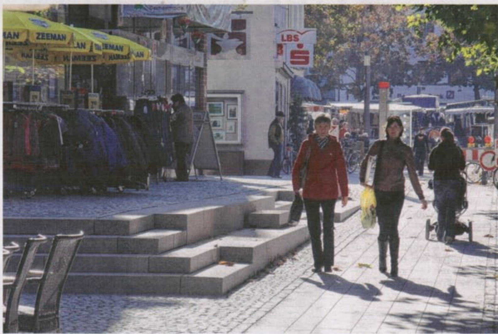
Plötzlich sieht der Vorbau klein und zierlich aus: Sitztreppen statt des voluminösen und nur schwierig zu pflegenden Beets mit Bodendeckern. Am letzten Schliff fehlt hier noch die Verfugung.

Restarbeit Michaelstor: Vom Großen Markt bis zum Michaelstor ist jetzt der vom Stadtrat gewünschte Pflasterstreifen, gelegt, der besonders gehfreundlich ist und insbesondere von älteren Bürgern mit Rollatoren gut benutzt werden kann. Gestern verlegten die Pflasterer die letzten Anschlüsse mit dem alten Pflaster. Bei der Aufnahme