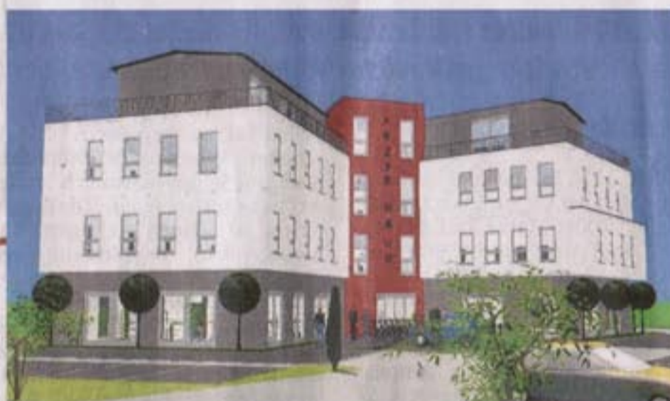
So könnte es am Rande des Dombogens künftig aussehen: rechts das Ärztehaus , oben Entwurfsansichten des Wohn-, Büro- und Geschäftshauses.