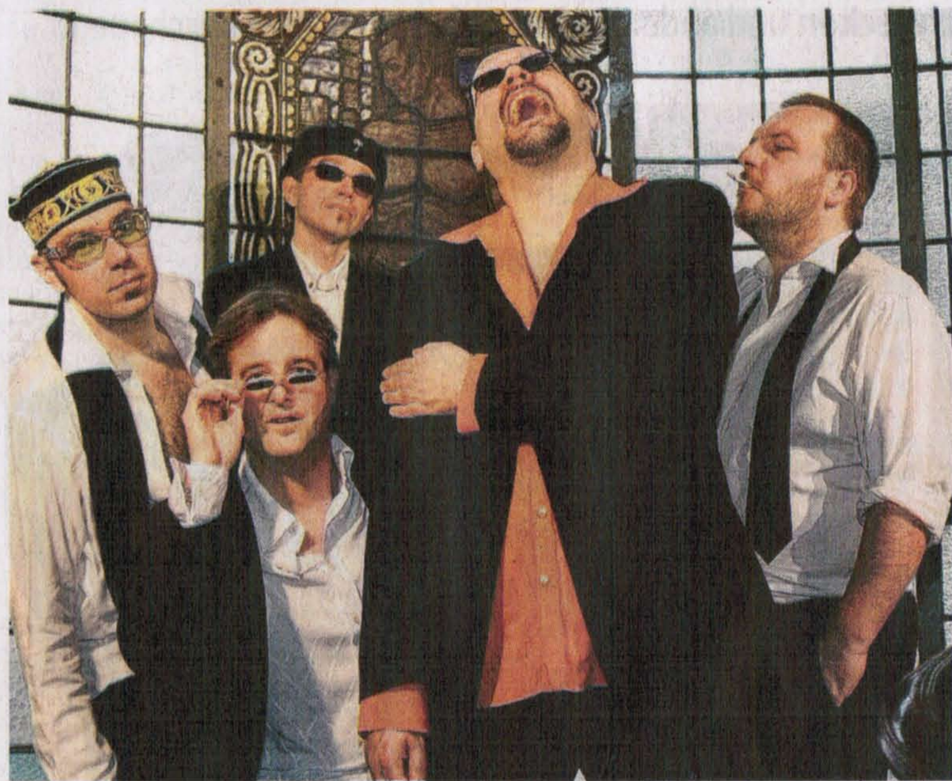
Mit Funk, Soul und R & B warten Granufunk (links) bei der Enni-Night of the Bands auf; Rockover ist das Markenzeichen von Küppers, Beck's & Brinkhoff's (rechts), die ausschließlich Stücke spielen, die jeder kennt.

Die Rheinische Post präsentiert jeden Montag Veranstaltungs-Highlights aus Kultur, Freizeit und Sport. Am Samstag ist Enni-Night of the Bands : Elf Gruppen und Einzelkünstler spielen in elf Xantener Lokalen.