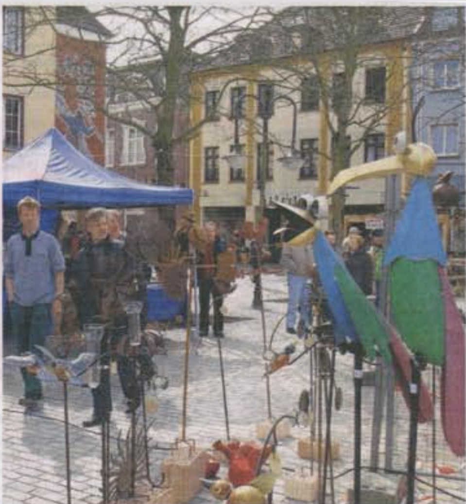
Komische Vögel: Kunsthandwerk in vielerlei Variationen lockte zum Schauen und kaufen.

„Xanten kann sich glücklich schätzen“ war ebenfalls ein oft gehörtes Kompliment. Vorbei sei die Zeit der Unebenheiten und Stolperfallen, die nicht nur Rollatorfahrern Schwierigkeiten bereitet hatten. „Die Steine waren einfach sehr glatt, vor allem, wenn es geregnet hatte“, meinte eine ältere Besucherin.